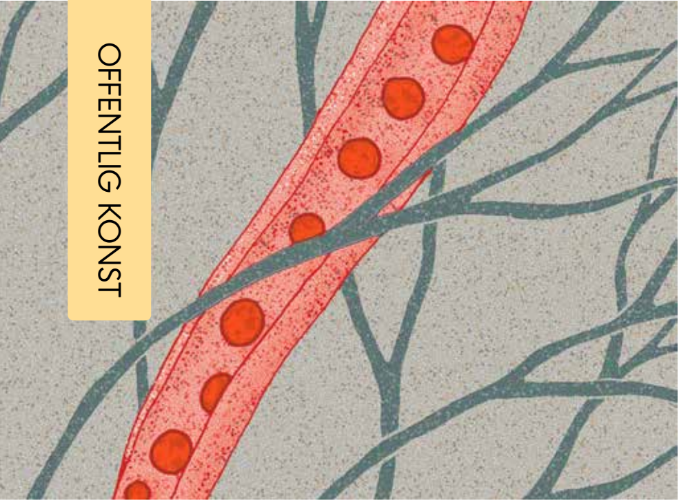
Skiss: Maja Droetto