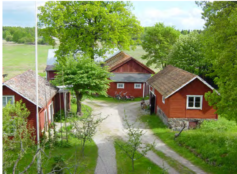
HISTORISKA REFERENSER TILL TUN-/GÅRDSBILDNINGAR