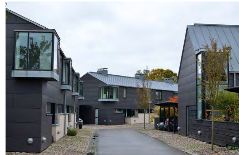
EXEMPEL PÅ HUSTYPOLOGI OCH SAMTIDA SMÅHUSREFERENSER