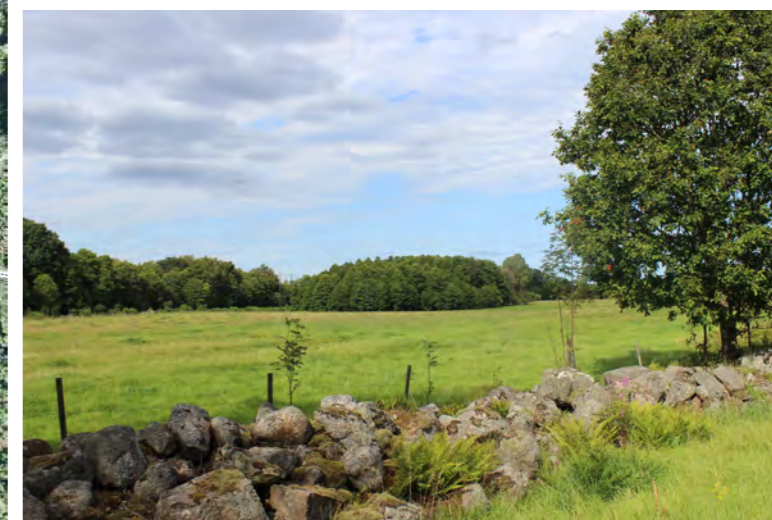
Befintlig stengärdesgård invid den gamla landsvägen