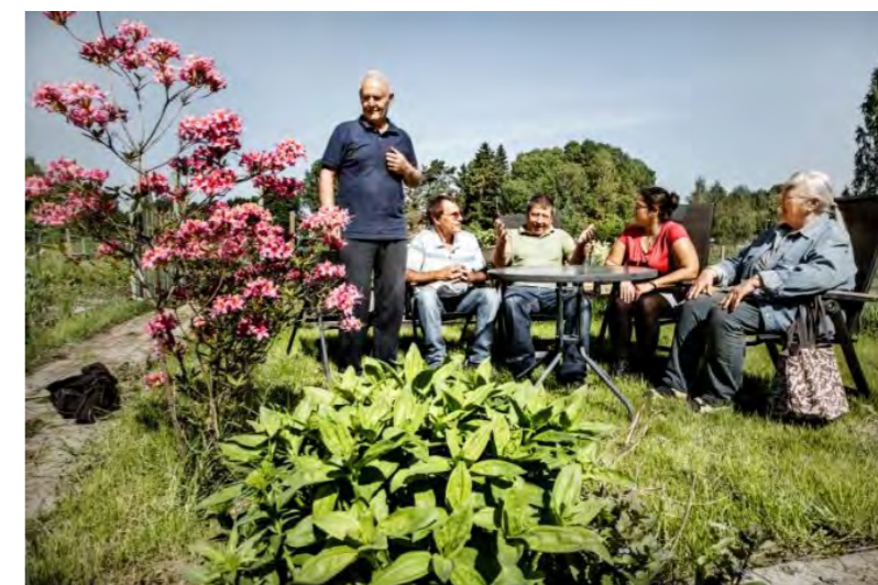
ODLINGSLOTTEN- ÖPPET LANDSKAP, HISTORIA, LÄRANDE, KONTINUITET PEDAGOGIK, TRIVSEL OCH SOCIAL HÅLLBARHET