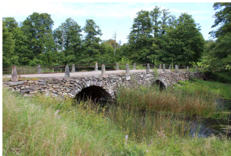
Bron vid Örsleds kvarn