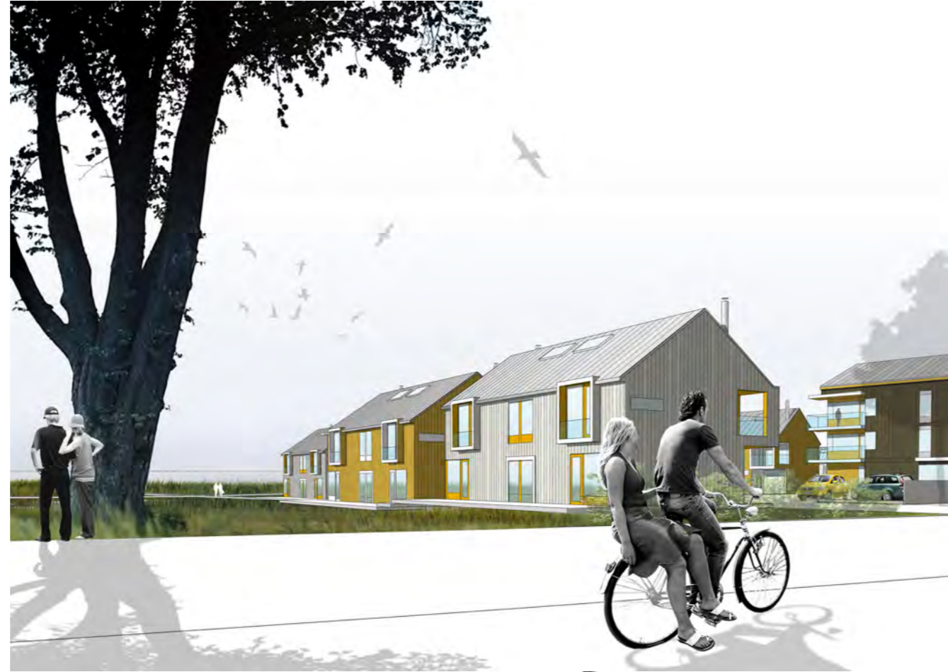
ILLUSTRATION ÖVER GÅRDENS "UTSIDA"